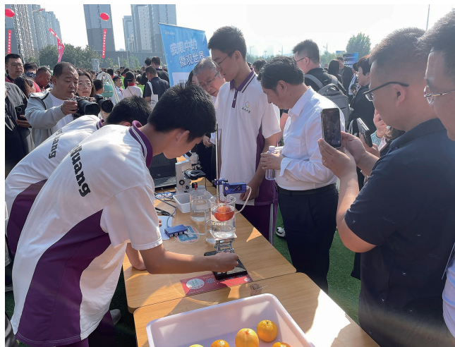
凤凰中学学生正在进行利用浮力测量未知液体密度的实验。

作为此次现场观摩交流活动启动仪式的阵地依托,路北中小学科技节精心策划“科学市集”和“科技作品”两大展示区域,42所学校、150余名师生对86个科技项目进行动态展示。生动有趣的讲解、游戏化的互动体验,吸引与会人员共同探索科技奥秘、感受科学魅力;科技作品与生活、劳动、文化的巧妙融合,展现了路北学子勇于创新、敢于挑战、追求卓越的风采,彰显出路北科学教育