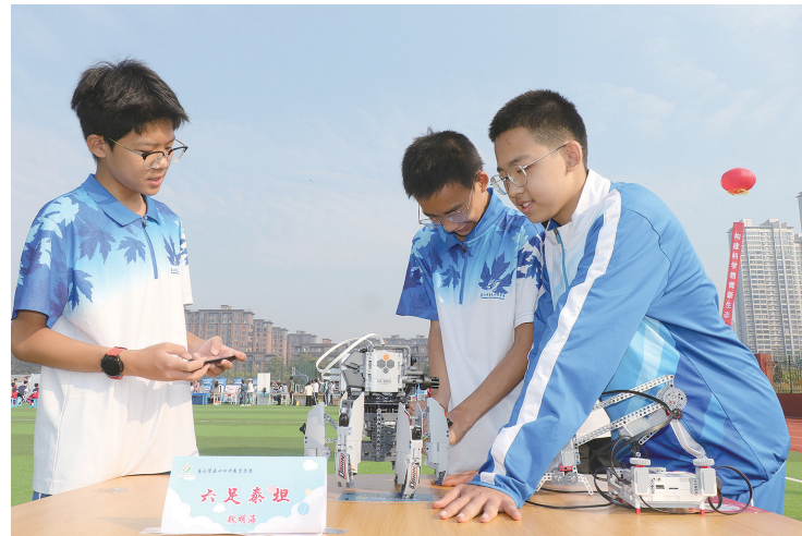
第五十四中学学生展示全地形探索机器人——六组泰坦。