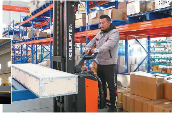
图为工作人员正在库房装载产品。